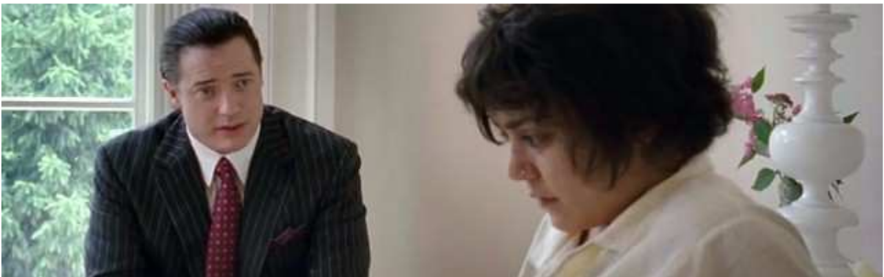
Brendan Fraser, en un gran papel dramático.

Actualizado 3 enero 2014 – Religión en Libertad