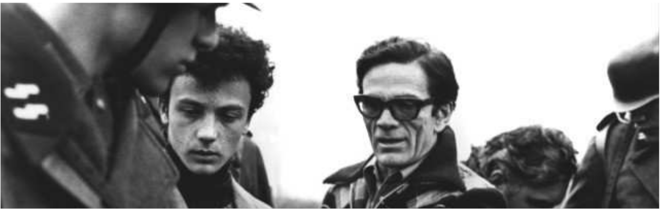
Pier Paolo Pasolini, filmando su última obra... su sensibilidad y espíritu libre le hacían condenar el aborto como un homicidio más